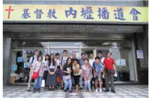
短宣隊在內壢播道教會前留下佳美腳蹤

這五天台灣短宣體驗是發揮美好隊工配搭和操練國語的機會。神保守整個行程與天氣，神又打開了我們的眼界，使我們見到台灣的福音需要。