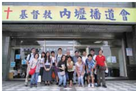
短宣隊在內壢播道教會前留下佳美腳蹤

這五天台灣短宣體驗是發揮美好隊工配搭和操練國語的機會。神保守整個行程與天氣，神又打開了我們的眼界，使我們見到台灣的福音需要。