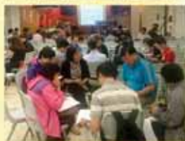
分組討論課堂上所學