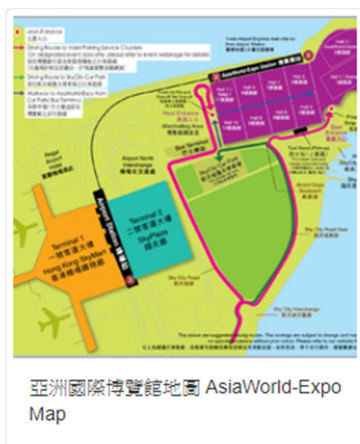
亞洲國際博覽館地圖 AsiaWorld-Expo Map