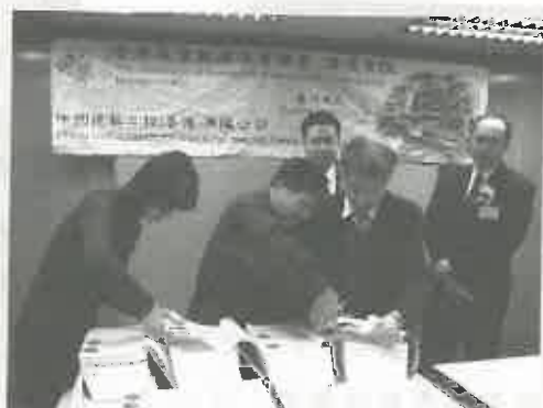
簽約嘉賓為合約蓋上鋼印