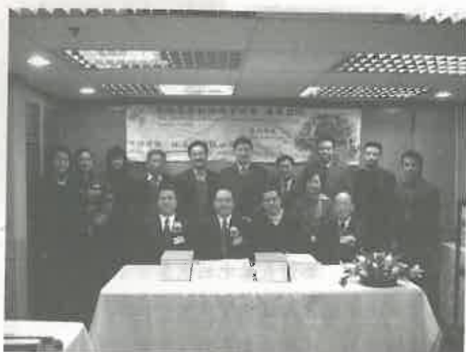
臨時學校管理委員會一眾代表與各來賓大合照

香港基督教播道會聯會播道書院 與中國建築工程(香港)有限公司 二零零五年二月廿一日 總會會議議室