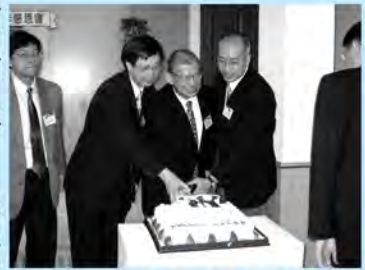
兒童之家五十歲了

本年五月二十七日為播道兒童之家五十週年感恩會的慶典，小小的禮堂坐滿了來自不同堂會關心播道兒童之家事工的嘉賓。天氣預告當天會下大雨，但感謝神，下午三時聚會開始前，雨勢開始減慢，其後完全停止了下雨，讓在門前迎賓的基督少年軍們不必受雨淋之苦，也讓到場嘉賓免卻大雨傾盆的狼狽。