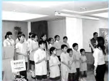
兒童之家詩班獻詩

作在兒童身上的美事，就是作在耶穌身上。陳牧師並指出，兒童之家回應了神的呼召：把小孩子帶到教會，讓他們有機會接受福音，回應主的大愛，並將耶穌的愛傳揚，更是中西教會合作的榜樣！