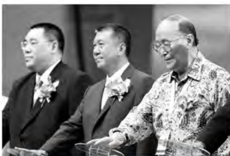
特首何厚鏞(中)主持大會開幕典禮按紐儀式

大會首晚，澳門特區政府社會文化司司長崔世安博士在漁人碼頭宴會廳設宴歡迎所有華福大會出席者，他在