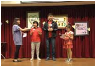
助養人分享看見孩子成長的感受