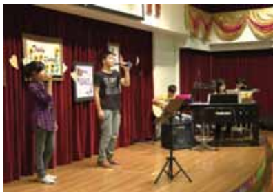
band隊獻唱「直到地老天荒」及「天天歌唱」

為了加強表揚孩子在困難中積極學習及努力成長，我們除了頒發個人自理、屬靈進步、自律守時、家務盡責等獎項外，更增設個人成就（體藝方面）、學科表現（個別科目成績突出）及品格良好獎（心地善良、正直及誠實）等，讓子孩子在各方面經驗成就感。