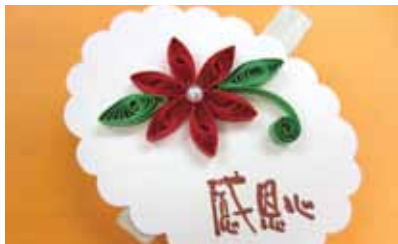
孩子製作的捲紙花紀念品